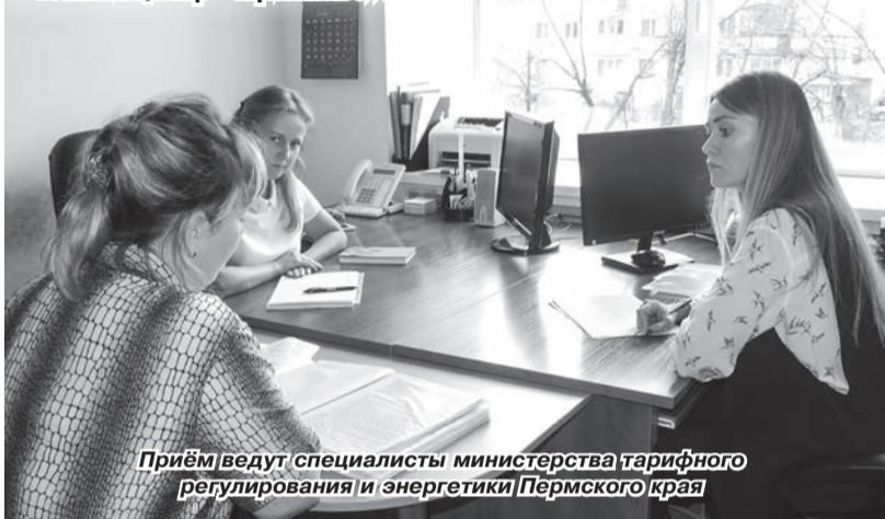
Приём ведут специалисты министерства тарифного регулирования и энергетики Пермского края

Специалисты краевых ведомств в сфере ЖКХ провели в Чайковском приём граждан по личным вопросам. Встреча состоялась 10 октября в здании администрации округа. На вопросы жителей ответили сотрудники министерства жилищно-коммунального хозяйства и благоустройства Пермского края, краевого министерства тарифного регулирования и энергетики, предприятия «Теплоэнерго», являющегося региональным оператором по обращению с твёрдыми коммунальными отходами, краевого фонда капитального ремонта многоквартирных домов, инспекции государственного жилищного надзора и ОАО «Комплексно-расчётный центр – Прикамье».