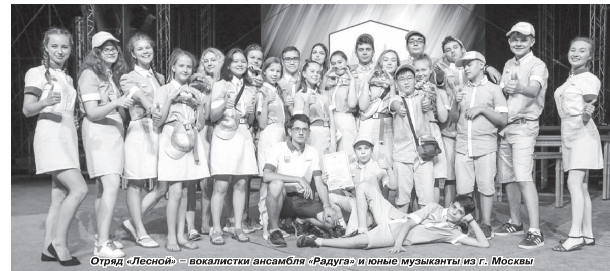
Отряд «Лесной» – вокалистки ансамбля «Радуга» и юные музыканты из г. Москвы

Неожиданным для себя называют девушки и участие в параде оркестров «По главной улице с оркестром» и концерте «Дети Артека – Крыму», посвящённого Дню молодёжи в Ялте. Сперва они выступили в роли флагиносцев, перед ними стояла задача – красиво пройти с флагами, размахивая ими, и при этом пританцовывать. Было сложно, но всё получилось! А в рамках концерта, они испол-